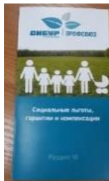
Брошюра «Социальные льготы, гарантии и компенсации»