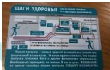
Календарь «Шаги здоровья»

В столовых размещены стойки для брошюр и рекламных проспектов о деятельности профсоюза.