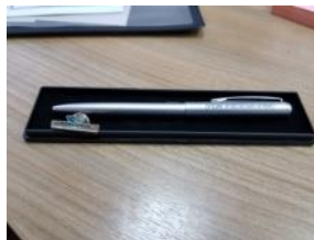
Ручки и значки