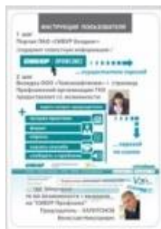
Инструкция по корпоративному portalу