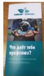
Брошюра «Что даёт тебе профсоюз?»