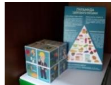
Информация на обеденных столах в столовых